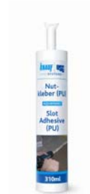
Knauf AQUAPANEL® Nutkleber (PU)